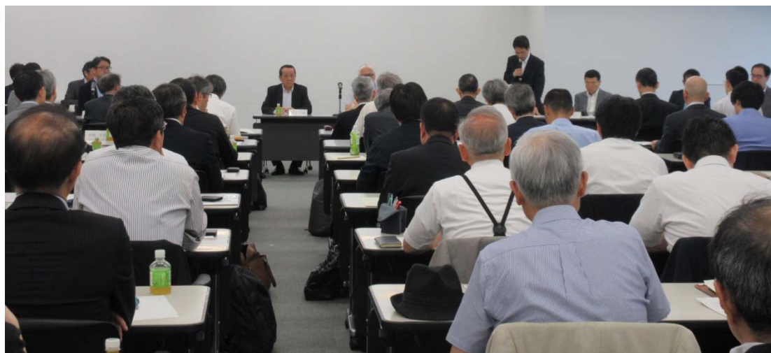
協議会会場の様子 国土交通省真鍋純住宅局長のあいさつ